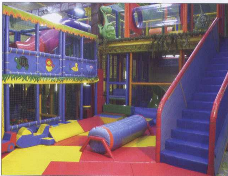
En la imagen, uno de los parques infantiles que comercializa Multiaventura

A su presencia en Andorra, Eslovaquia e Italia, con un establecimiento en cada país, y en Portugal, donde la empresa española cuenta con siete locales, habría